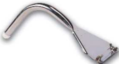
Rasqueta Inox RP1-001