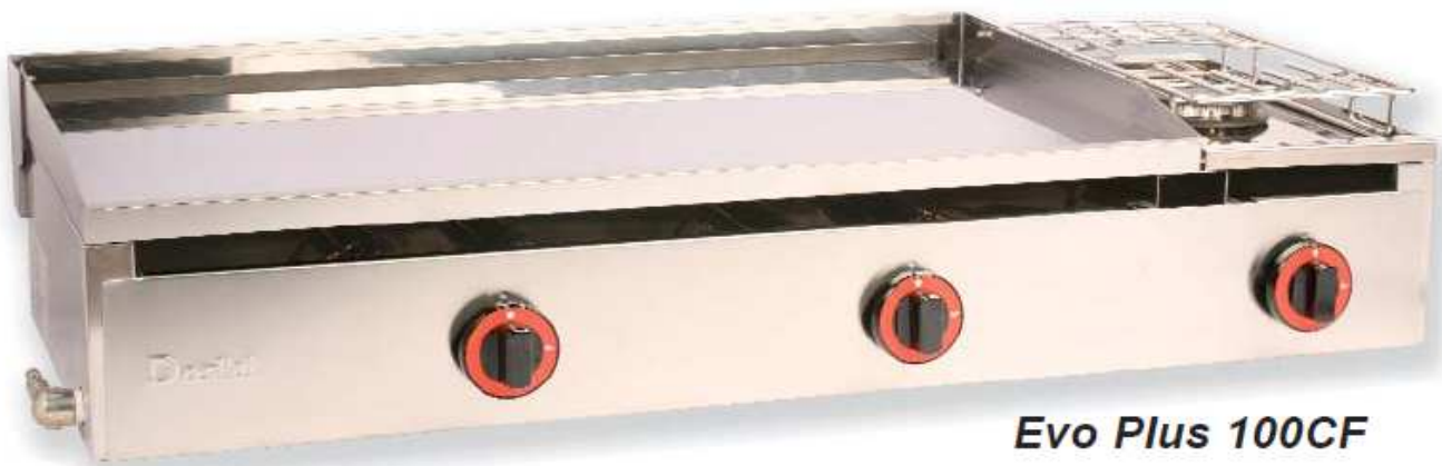
Evo Plus 100CF