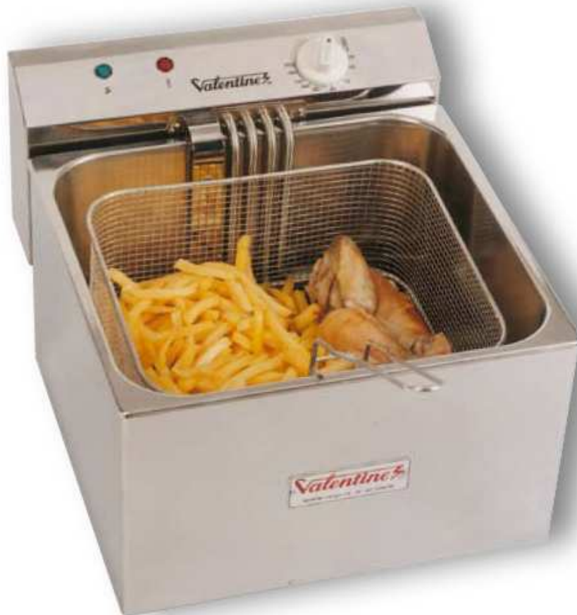
Mod. Maxi 6000