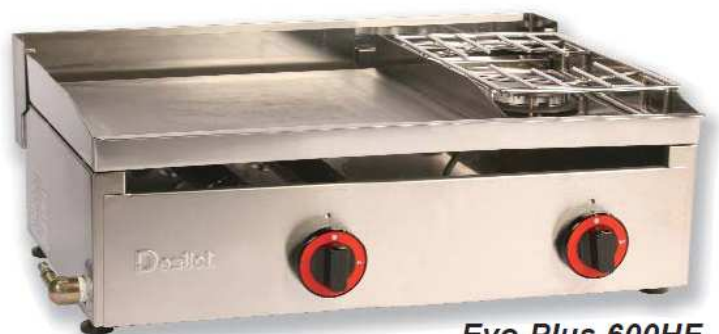
Evo Plus 600HF