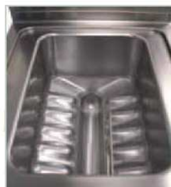
Detalle de la cuba